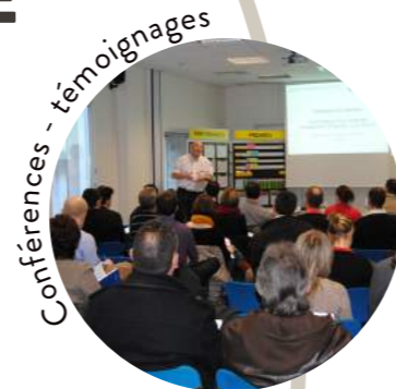
Conférences - témoignages