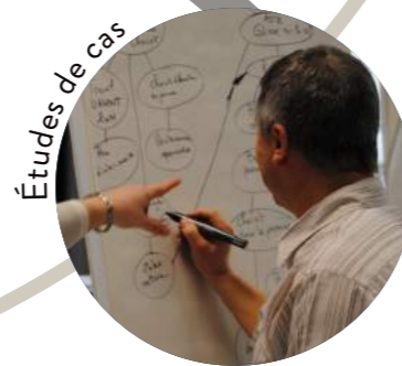
Études de cas